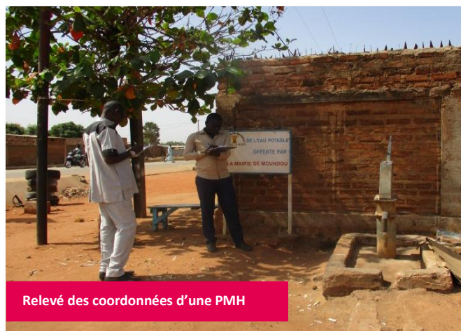
Relevé des coordonnées d'une PMH

Enfin, la phase d'analyse a par la suite fait l'objet d'une consolidation grâce aux apports effectués par les autorités communales, les conseillers municipaux, la Direction technique de la Mairie de Moundou, les chefs de services déconcentrés de l'Etat, les délégués d'arrondissement et les chefs de quartiers avant une validation finale en atelier réunissant l'ensemble des parties-prenantes.