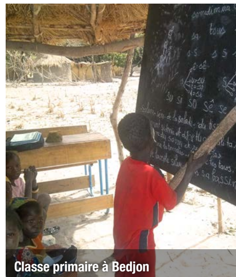
Classe primaire à Bedjon

En 2009, notre appui s'est progressivement étendu et touche aujourd'hui 21 écoles rurales. A l'instar du reste du pays, l'éducation y est de mauvaise qualité : 25,7% de la population adulte est alphabétisée et seuls 37,5% des enfants sont scolarisés. Les écoles "communautaires" sont majoritaires en zones rurales. Ces dernières sont gérées par les associations de parents d'élèves (APE), en charge du recrutement des maîtres, de la gestion de l'école et de la collecte des frais d'écolage qui permettent le paiement des maîtres, les travaux de construction et de réhabilitation des écoles. Ces associations ne bénéficient malheureusement pas toujours des compétences nécessaires à la gestion globale des écoles. L'offre scolaire, payante et de mauvaise qualité, n'incite donc pas les parents à scolariser les enfants.