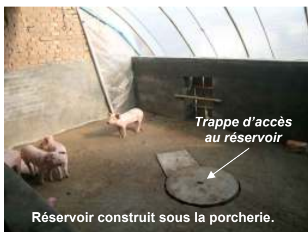
Réservoir construit sous la porcherie.

Le projet d'ID de diffusion de digesteurs à biogaz s'effectue dans un objectif plus large d'amélioration de la vie de populations rurales ayant un accès faible à l'énergie et aux nouvelles technologies. A ce projet est donc intégré un ensemble d'activités et d'autres infrastructures, qui favorisent l'intégration et l'appropriation du biogaz :