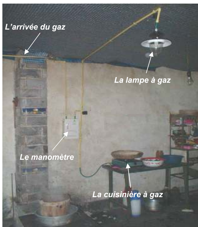
L'arrivée du gaz