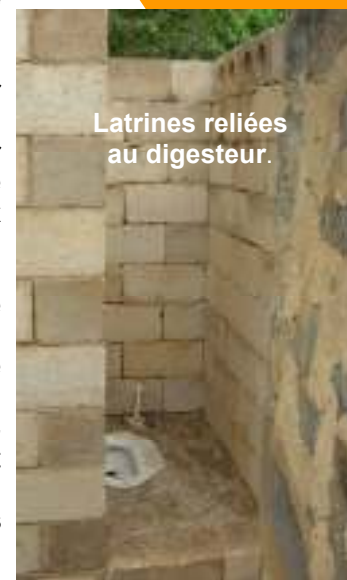
Latrines reliées au digesteur.

seront introduits dans le digesteur et celui où le biogaz sera exploitable (temps nécessaire à la formation des bactéries méthanogènes).